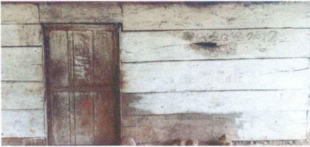
Foto 1: En esta imagen se observa que las paredes de la cocina se encuentra en muy malas condiciones por lo que necesita sustitución.