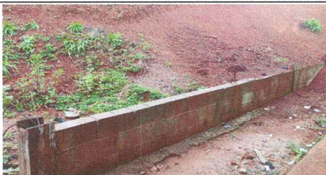
Foto 5: En esta imagen se observa que este muro necesita reforzarse.