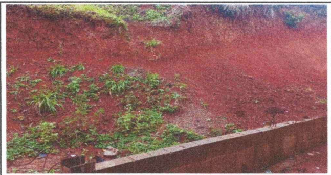
Foto 6: Una segunda imagen del muro y del riesgo que se tiene por deslizamiento por lo que es importante elevar la altura y reforzar el muro.

Observación: Si es necesario se pueden agregar hojas adicionales y actualizar el número de hojas.